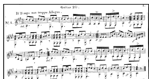
Manoscritto della parte della Chitarra 2